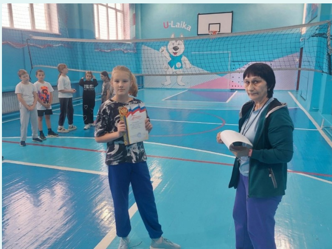
Ольга Кирилловна физической куль-

Поздравляем ребят и желаем дальнейших успехов в спорте!